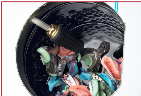
Beispiel 1: Befüllte Trommel mit Abdrucklöffeln.