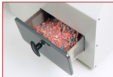
Abfalllade mit Alginat- und Gipsresten.