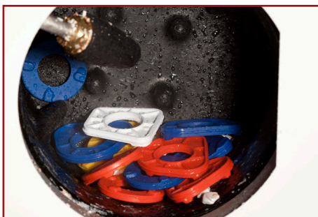
Kunststoffartikulationsplatten nach dem Reinigungsprozess.